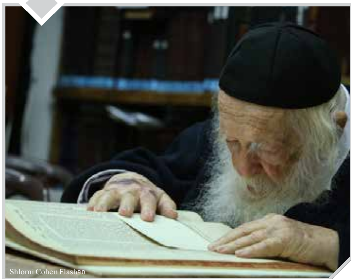
Shlomi Cohen Flash90

מרן הגאון רבי חיים קניבסקי שליט"א, בלווי צמוד לתלמיד