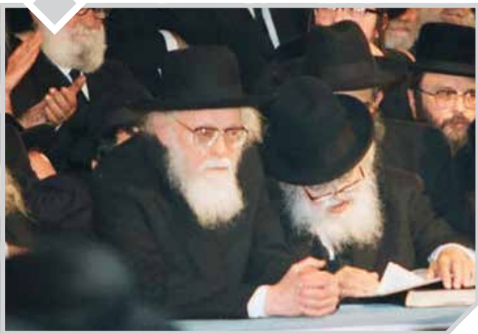
"אדם כי יקריב מכם" (ויקרא א', ב')

כך שיכנע מרן הגרא"מ שך זצוק"ל את הגרי"ש אלישיב זצוק"ל, להנהיג את כלל ישראל