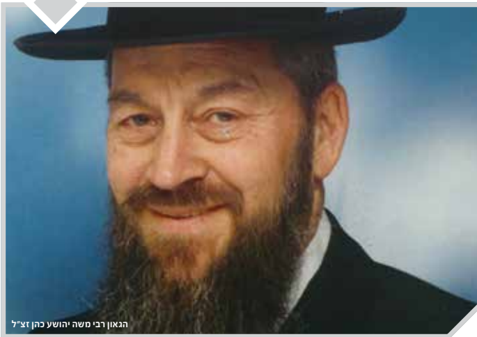
הגאון רבי משה יהושע כהן זצ"ל

הצצה לרגעים מרגשים שתופסים את תשומת הלב בתוך מרוץ החיים השוטף