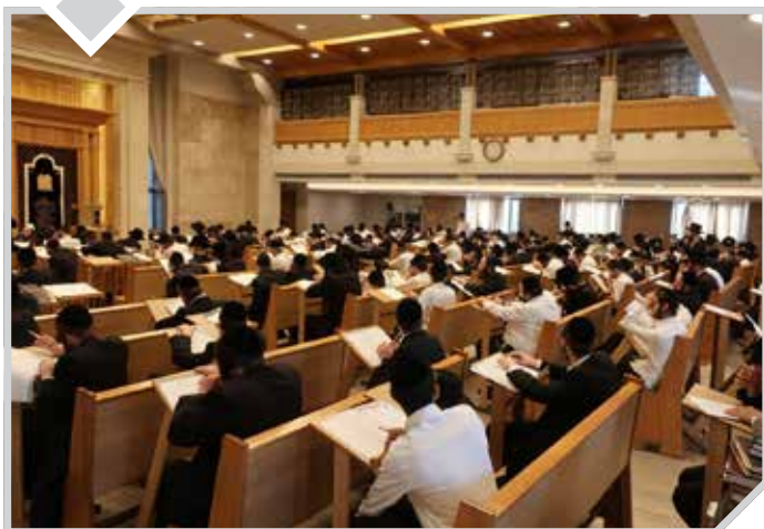
המבחן השלישי במסגרת קניין ש"ס על 630 דפי גמרא

סדרת שיחות עם אנשים מופלאים הנבחנים על כל הש"ס