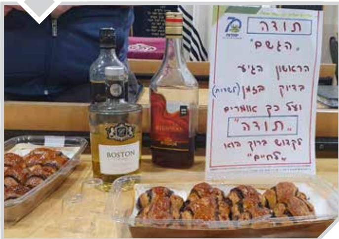
ה'לחיים' שהביא לבית הכנסת ר' דוב פישר