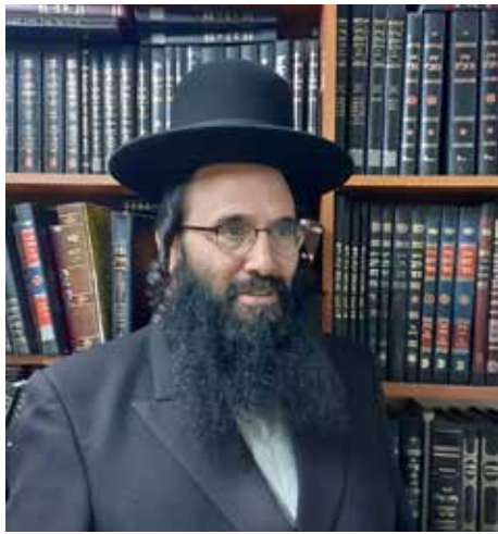
הרב יעקב ולנשטיין