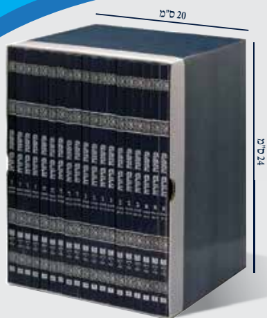
* כריכה רכה, פורמט רגיל, 19 חוברות