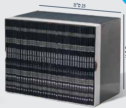
* כריכה רכה, פורמט כיס, 38 חוברות