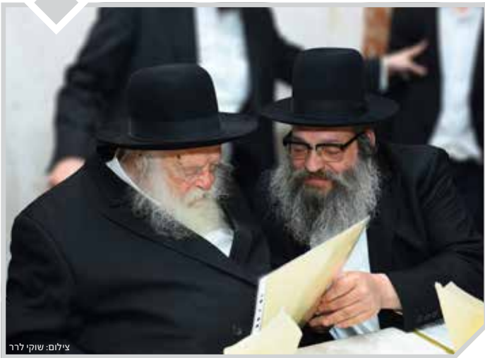
"ראשי אלפי ישראל הם" (במדבר א', ט"ז)

שיחה מרתקת במעון בנו הגדול של רשכבה"ג מרן שר התורה זיע"א יבלח"ט הגאון רבי אברהם ישעי' קניבסקי שליט"א ראש כולל 'ארחות יושר', על ששים שנות חיים בצילו של האבא מרן שר התורה זיע"א