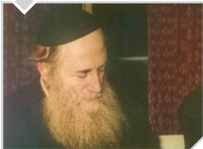
הגאון הגדול רבי צבי שרגא גרוסברד זצ"ל

"וְשִׁנַּנְתֶּם לְבַבְיָהּ" (דברים ו', ז')