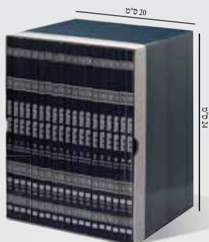
* כריכה רכה, פורמט רגיל, 19 חוברות