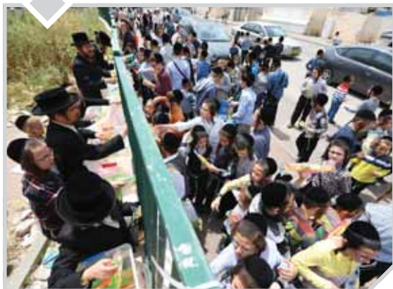
שזכתה עירנו לחברת תהילים - ענני".