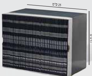
* כריכה רכה, פורמט כיס, 38 חוברות

3 תרום 24 למשך 15 סך כל התר וקבל סט 'משנ ו' חלקים כ ספר 'ה על הכ