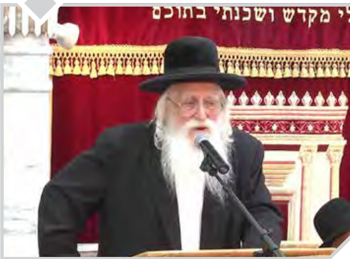
"וּנְבָרְכוּ בְךָ כָּל מְשֻׁפָּחַת הָאֲדָמָה" (בראשית י"ב, ג')

הגה"צ רבי אריה שכטר זצ"ל: כמה גדולה קנאת סופרים המרבה חכמה בישראל