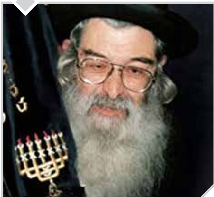
"בְּחֶרֶבִי וּבְקִשְׁתִּי" (בראשית מ"ח, כ"ב) בצלותי ובבעותי