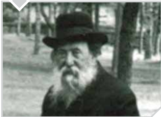
הגאון רבי חיים עוזר גורודז'נסקי זצ"ל

קילוגרם חיטים, הקים מאפיה קטנה ואפה שם מצות כשרות ליהודי האיזור.