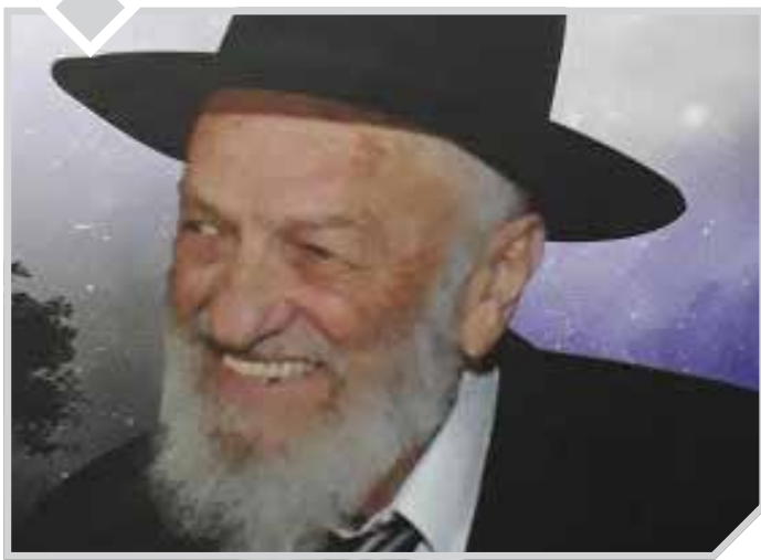
"איש אשר רות בו" (במדבר כ"א, י"ח)