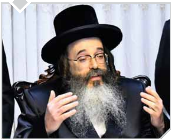
"לְאִסֹּר אֶסֶר עַל נַפְשׁוֹ" (במדבר ל, ג')