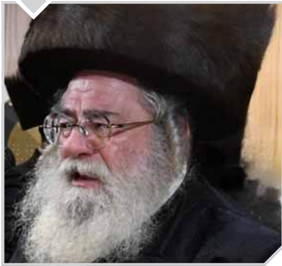
הגאון הרב חיים אטיק שליט"א

שרוצה לראות אותו. הם פחדו להיכנס פנימה, וסבא פחד לצאת החוצה כדי שלא יפריעו לו ללמוד... רק לאחר מכן שמע מי היה אותו רב שרצה לראותו, והצטער מאוד שלא יצא לקראתו, פעמים רבות היה מזכיר זאת בצער גדול על ההפסד שהפסיד בכך שלא הלך אליו.