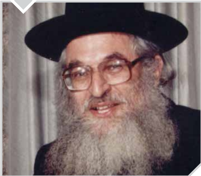
הכל נמצא, רק תיקח.

על התפילות שמגיעות לכסא הכבוד והישועות ששואבים ממעיני הישועה