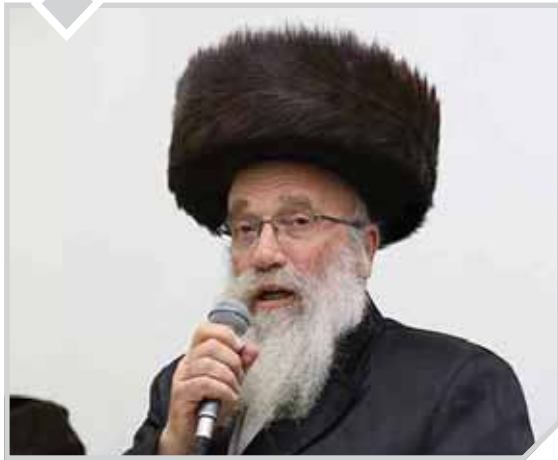
הגאון רבי שמואל אליעזר שטחן שליט"א