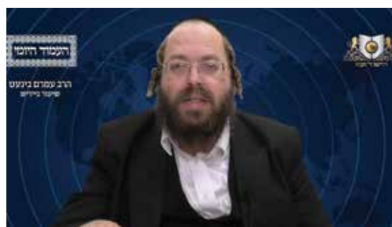
הרב עמרם בינעט שליט"א - אידיש