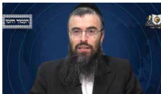
הרב אריה זילברשטיין שליט"א - עברית