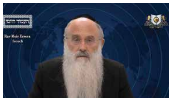
הרב מאיר ערערא שליט"א - צרפתית