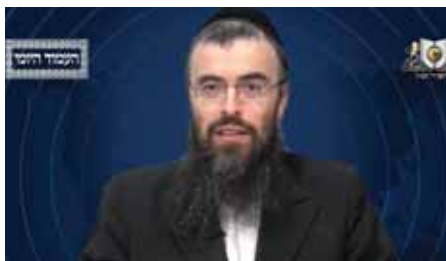
הרב אריה זילברשטיין שליט"א - עברית