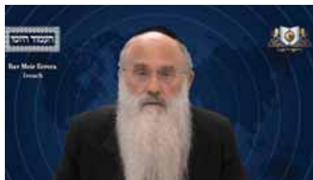
הרב מאיר ערעא שליט"א - צרפתית