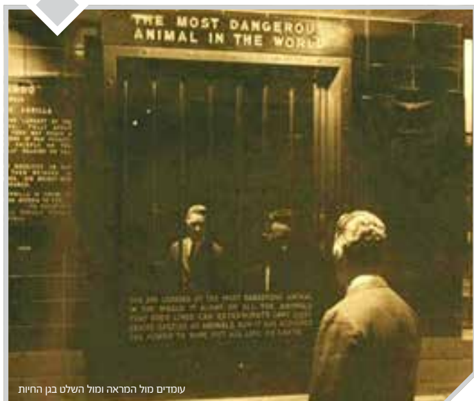
עומדים מול המראה ומול השלט בגן החיות

על הכרזה בשעריו של אחד מגני-החיות הגדולים בעולם