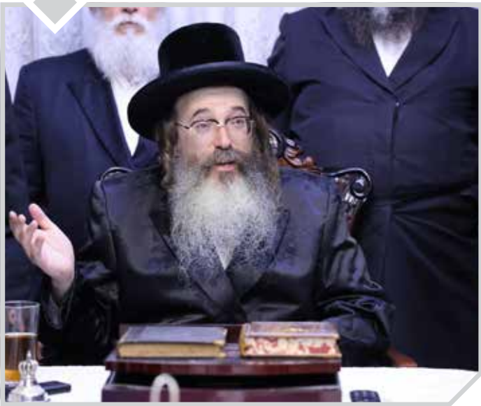
וְלֵאמֹר מִלְאֵם יֵאָמֵץ (כה כה)

כ"ק מרן אדמו"ר מתולדות משה שליט"א על ההשגחה המופלאה שהתגלתה בתוך הסתר הפנים הגדול ביום שמחת תורה