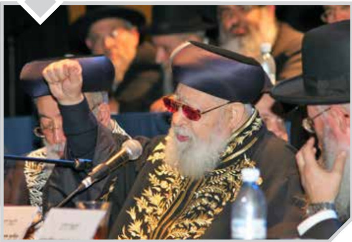
"וַיִּבְכוּ הָעַם בְּלֵילָה הַהוּא" (במדבר א', י"ד) חתם כתיבתם בכיה של חנם (מעניית כט)

דרכו של מרן בעל ה'בייע אומר' הגאון רבי עובדיה יוסף זצ"ל, ללמד תורה בשמחה ולשמה לבבות שבורים בכל עת