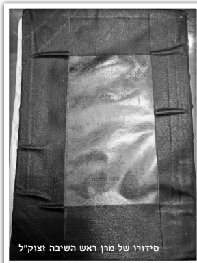
סידורו של מרן ראש השיבה זצוק"ל

מליון דולר (!! ) עבור הכוללים, בתנאי שיקבל את הסידור הישן של הרב שטיינמן, ומיד הגיב הסבא בחריפות: 'למה הוא צריך את הסידור שלי?! זה עבודה זרה!!' - ולא הסכים בשום אופן לתת את הסידור, ואיך יכול להיות שלך הוא כן הרשה לקחת את הסידור?! אמר לו מחותני: "בוא עמי, ניכנסו אל הרב שטיינמן, ושאל הנכד: "האם זה נכון שהסבא הרשה לו לקחת את הסידור?!". שאל הרב שוב את מחותני: "למה אתם צריכים את זה?", ענה לו: "אני פשוט רוצה איזו מזכרת לבני", אמר לו הרב שטיינמן: "אתם יכולים לקחת אותו..."