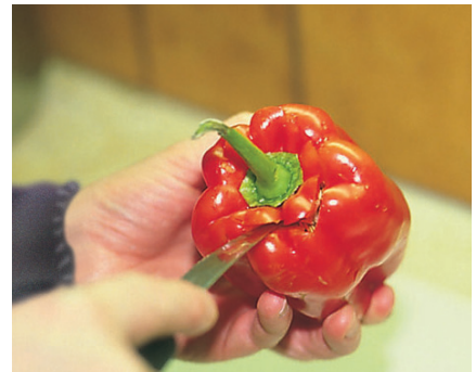
מסירים את חלקו העליון של הפלפל או חוצים את הפלפל לאורכו