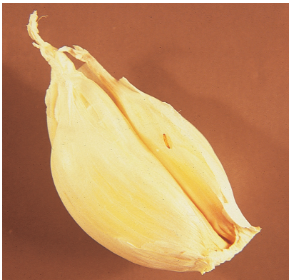
זחל עש בין שיני שום

● ירקות עלים מגידול מיוחד "ללא חרקים" - יש להפריד, להשרות ולשטוף כפי ההוראות הרשומות על האריזה.