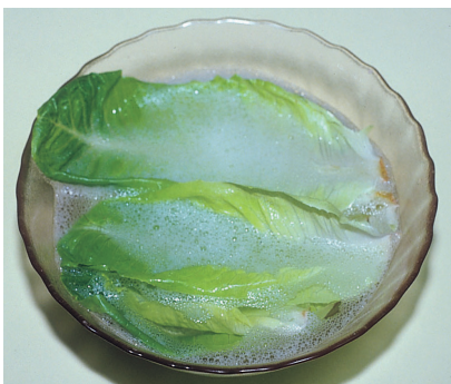
להפריד את העלים להשרות במי סבון ולשטוף עלה עלה