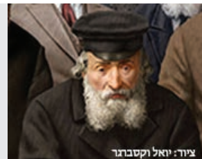
ציור: יואל וקסברגר