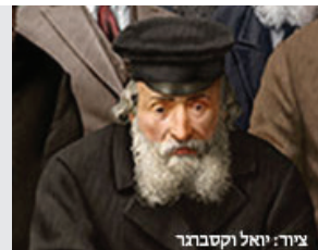
ציור: יואל וקסבורג