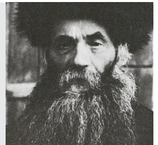
ועצם לא תשברו בו (שמות יב מו)

הסבא, ואף גילה את אזני רבי איסר זלמן כי ממנו לא יצמח כלום. תמה רבי איסר זלמן מנין לו זאת, והשיב הסבא: "אין לו דרך ארץ. בשעה שהוגשו לפני הבחורים כוסות תה, נשפך מעט סוכר על המפה, טבל אותו בחור את אצבעו בסוכר והכניסה לפיו... ממנו לא יצמח כלום!" - קבע הסבא. וכך היה. לימים נתמנה אותו פלוני לרב באחת מערי הארץ, עד שנאלץ להתפטר מרבנות זו ונעשה עורך דין, ואחר תקופה נתפרסם שמו כמי שנתפס על זיופים והושב בבית הסוהר.