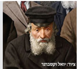
צויר: יואל וקסבורג