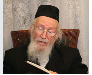
הלוח ואינו משלם (אבות ב ט)

אינני קונה חליפה ארוכה, כי אצטרך לקחת בשביל זה הלוואה. ומרן החזון"א נהנה מאוד מהתשובה.