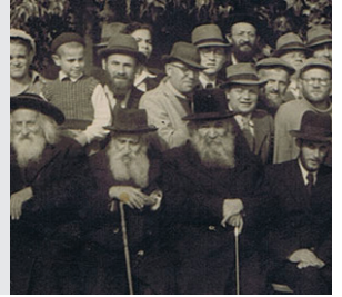
ויקחו לי תרומה (שמות כה ב)