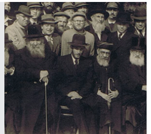
נְרָפִים אִתָּם נְרָפִים (שמות ה' ז')

סיפר הבחור שהגרא"א משקובסקי נתן מיד שאגה גדולה: "מה? אתה במשבר?!"... והמשיך מיד ואמר: "תדע לך, שאני - כל יום מאה פעמים במשבר"