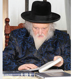
ויט שכמו לסבול (בראשית מט, טז) מפרש רש"י: "עול תורה".