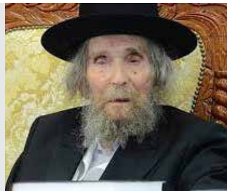
שבת דף קמט