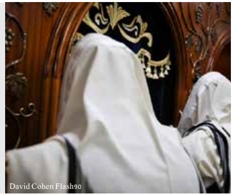
David Cohen Flash90