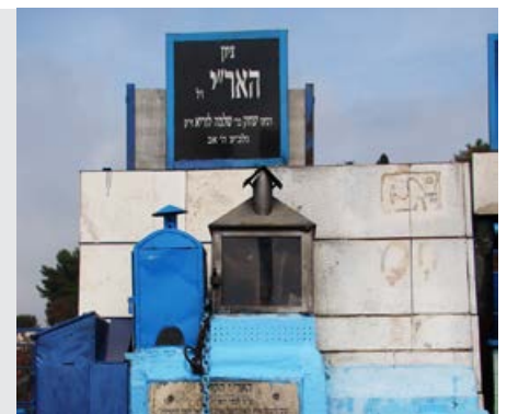
שבת דף קנז