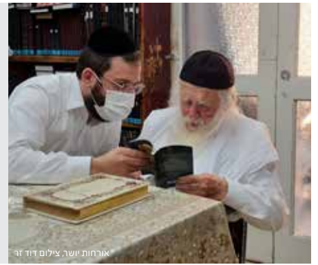
ארחות יושר

הוראות, הדרכות ועובדות ממרן שר התורה הגר"ח קניבסקי שליט"א, שגרשמו ע"י נכדו נאמן ביתו הרה"ג ר' אריה קניבסקי שליט"א