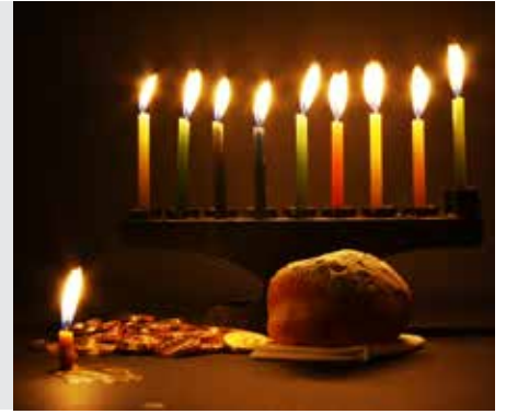
עירובין דף יא