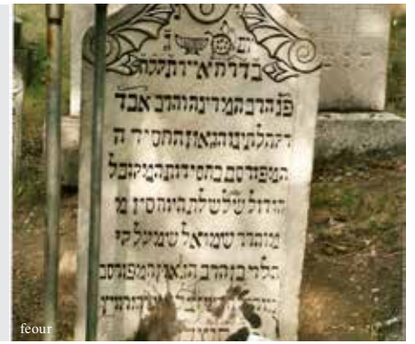
שבת דף קמה

כשסגר הגה"ק רבי שמעלקא מניקלשבורג זי"ע עצמו בחדר, נעמדו כמה אנשים מאחורי הדלת כדי לשמוע מה מעשיו. לתמיהתם שמעוהו אומר לעצמו: "שלום עליכם מורינו ורבינו..."