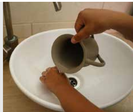
עירובין דף לא