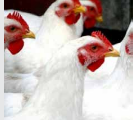
עירובין דף לט