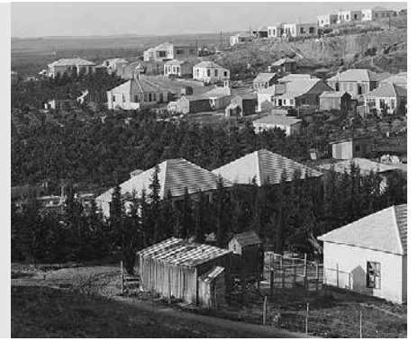
עירובין דף טו