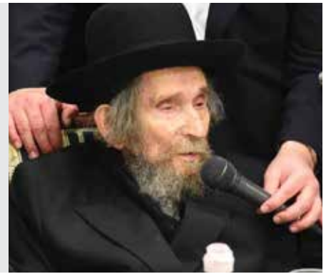
שבת דף קלא