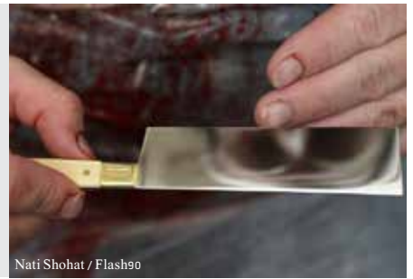
Nati Shohat / Flash90

כי קיימת עדיפות לבדיקת הסכין על ידי חכם; ועוד, שמחמת התנאים הנדרשים לבדיקת הסכין, דומה הבדיקה ל'הוראה' של חכם, ולכן יש לכבד את החכם להורות. במשך הדורות, התבטל מנהג זה, וסומכים על כך שאין השוחט רשאי לשחוט ללא הרשאה מחכם, המכונה 'כתב קבלה'; ובהרשאה זו - החכם כביכול מוחל על כבודו, ופוטר את השוחט מהצורך להראות לו את הסכין לפני כל שחיטותיו בעתיד.