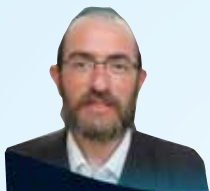
הרב מרדכי שלמה פריינד שליט"א הדף היומי בהלכה • אידיש שלוחה 1/3/1