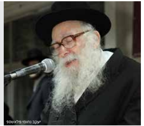
שבת דף קיד

הגר"נ קרליץ זצ"ל: "להיות עני זה לא בושה, ולכן ללכת עם כובע מיושן אין בו כל פגם, אולם עצלות היא מדה מגונה, ויש להבריש את הכובע מאבק והמזניח את עצמו הרי זו עצלות ובושה"