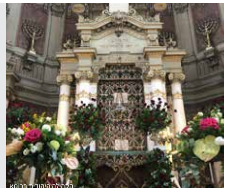
הקהילה היהודית ברוסא

העץ, ועל ידי ראיית הענפים, יתעוררו להתפלל על הפירות. והגר"א ביטל מנהג זה, כיון שבזמננו נוהגים הגויים להעמיד ענפי עצים בבתיהם בימי חגיהם. ויש הסוברים שמטעם זה יש לבטל אף את מנהג הקישוט בעשבים, ויש חולקים.