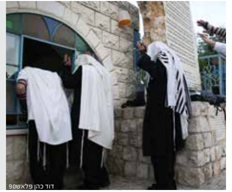
דוד כהן פלאשט

ושלושת הימים שלאחריו הם 'ימי ההגבלה', בהם התכוננו בני ישראל לקבלת התורה.