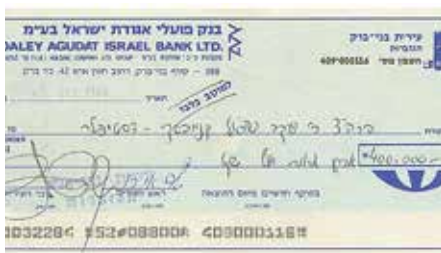
בית המכירות הפומביות קדם, ירושלים

נחשף מכתבו של מרן הסטייפלר זצ"ל, בו הוא מודיע על סירובו לקבל מעיריית בני ברק מענק בסך 400,000 שקלים - ומשיב לה את הצ'ק שנשלח אליו