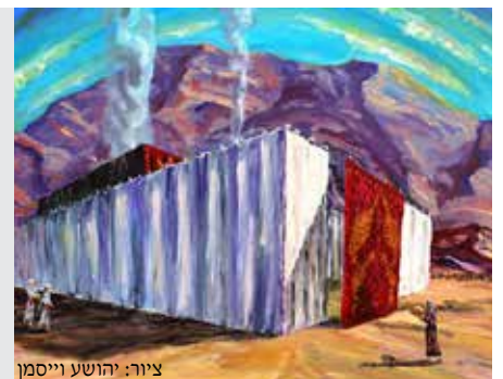
צירוף: יהושע וייסמן

ביום זה, לאחר שהקים משה רבינו ע"ה את המשכן, החלו שבעת ימי המילואים.