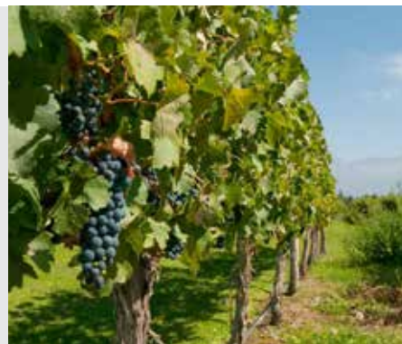
שבת דף יג

"משום לך לך אמרי נזירא סחור סחור לכרמא לא תקרב"