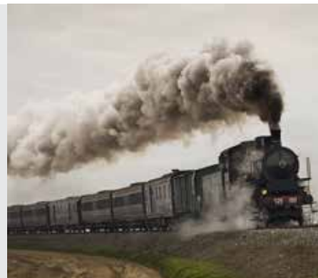
שבת דף נג