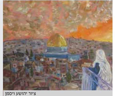
ציור יהושע ויסמן

בניסן עתידין להגאל: רמזים מפעמים ומטלטלים על פעמי הגאולה הנשמעים בימים אלו