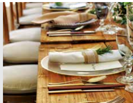
שבת דף מו

"ואין גורדין אותה בשבת בזמן שיש עליה מעות"