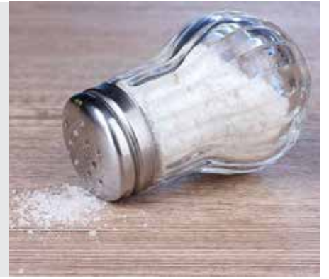
שבת דף מז