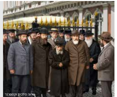
איור: מלכות וקסברגר