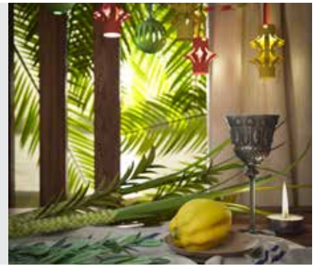
סוכה דף ד