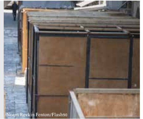
Noam Revkin Fenton/Flash90

מה כאחת מדפנות הסוכה, ולפיכך, למרות שלסוכה בעלת שתי דפנות מקבילות נדרשת בדרך כלל דופן שלישית בת יותר מארבעה טפחים, כנ"ל, במקרה זה, די בדופן נוספת - בצד הפתוח - בת מעט יותר מטפח בלבד, כדין סוכה בעלת שתי דפנות צמודות, (ראה תקציר לאתמול).