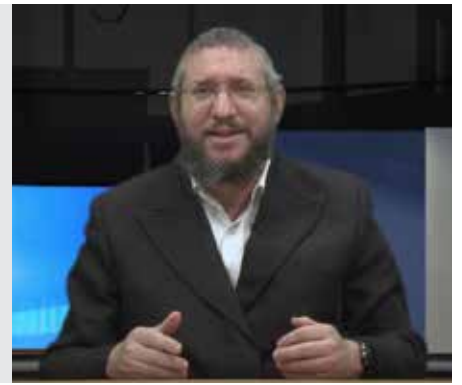
סוכה דף כט